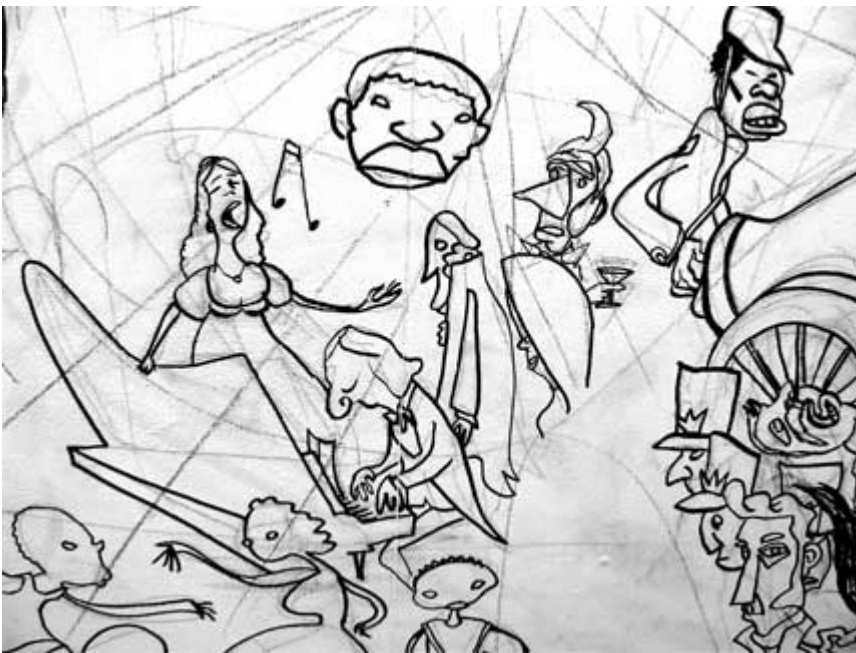
Ilustración: REP / Mural por el Bicentenario (detalle)