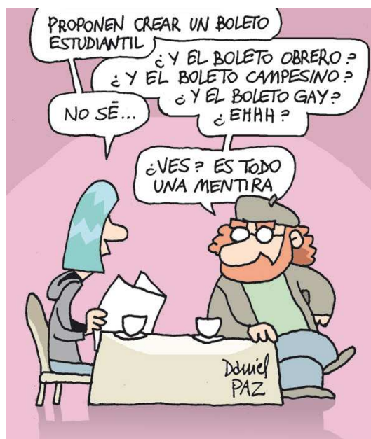
Daniel Paz "Página 12"

Compartimos una propuesta de reflexión - acción colectiva. Un recorrido por cinco grandes ejes para interrogar y promover la participación y organización juvenil. El segundo conjunto de fichas, las organizaciones, los jóvenes y la participación, busca poner en juego una caracterización de la etapa actual señalando límites y desafíos.